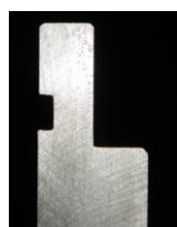
標準クランプ用金型 (ご提供中)