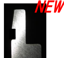
ワンタッチクランプ用金型 (新発売)