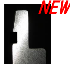
ワンタッチクランプ用金型 (新発売)