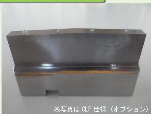
※写真は CLP 仕様 (オプション)