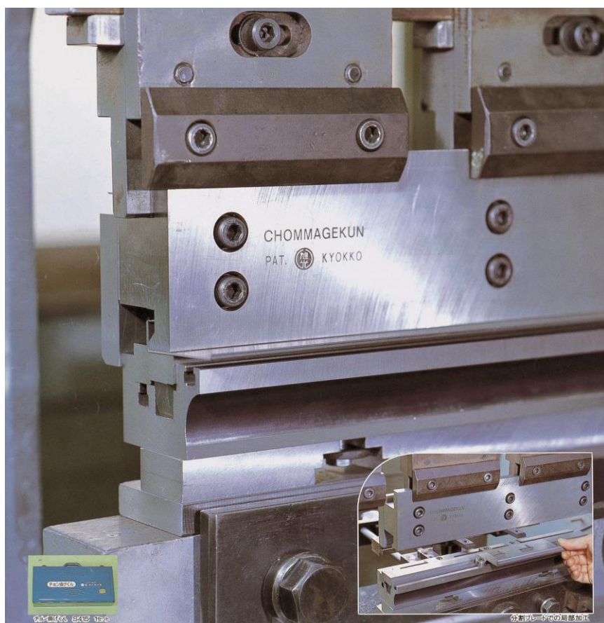
製造事業者：(株)旭光製作所