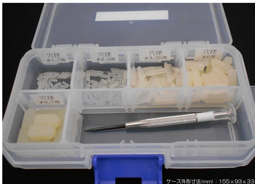
ケース外形寸法(mm) : 155×93×33