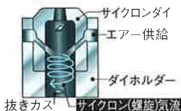
抜きカス / サイクロン螺旋気流

業界初! サイクロンジェット方式採用により、抜きカスをより強力なサイクロン(螺旋)気流で除去します。安定したタレットパンチプレス加工に最高のパフォーマンスを発揮します。