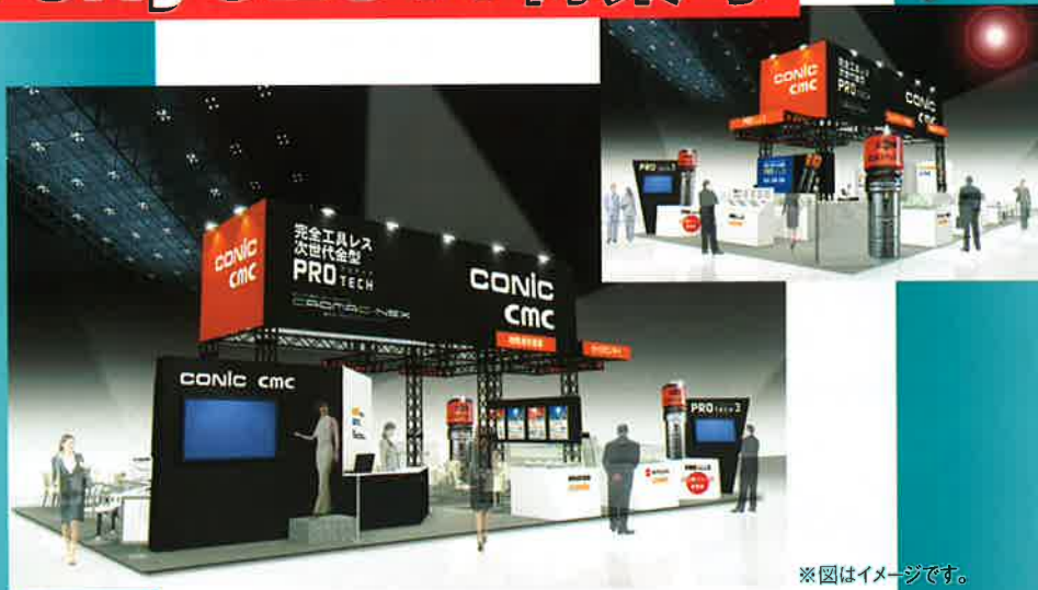
※図はイメージです。