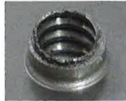
従来のバーリング金型